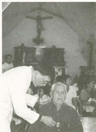
一支聽診器和一雙溫暖的手，撫慰了災民身心的創傷

2001年元月13日，一場突如其來來強震，為許多薩爾瓦多人帶來畢生難忘的經驗！平凡樸實的生活彷彿在一夜之間變成了人間煉獄。一位老先生正聲嘶力竭的哭喊著，身旁躺著了幾具親人的遺體，邊哭泣邊用他那雙躺著血跡混著泥土的雙手向路人求援：「誰來幫幫我？我的女兒還被埋在裡面……」。在這個最黯淡的時刻，慈濟人醫會勘災團在第一時間到達這片被撕裂的大地，由五位醫師組成的臨時診療小組馬不停蹄的展開義診行動。他們在臨時組成的診療所中，