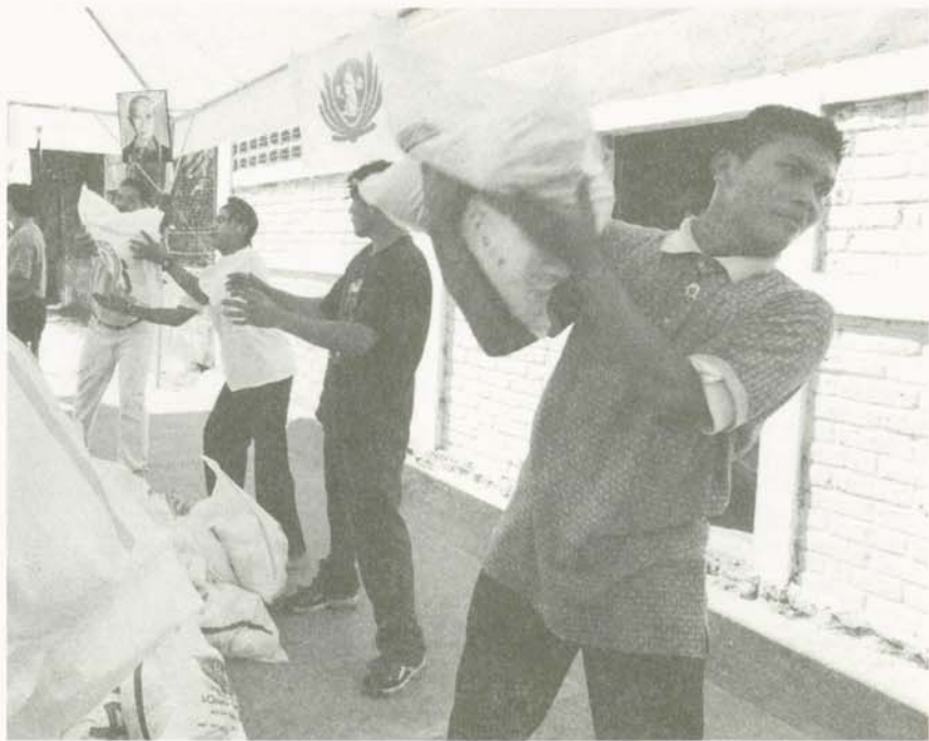
慈濟國際人醫會在全球有40個服務據點，依各地特性做義診、往診及居家關懷，發生緊急重大事件時，也會跨國支援

慈濟國際人醫會的服務項目，因各國民情、法令而有不同，例如台灣的人醫會，定期、定點巡迴偏遠山區及離島