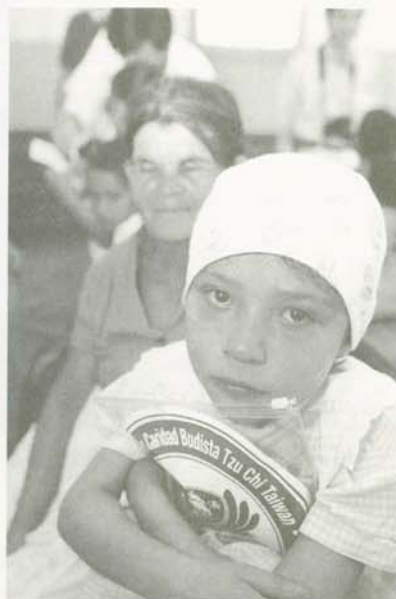
罹患先天性心臟病的孩子緊握著慈濟發放的物資，原本清寒的生活因無情震災，更是雪上加霜