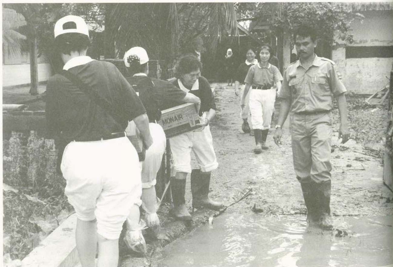
志工捲起褲管，在豪雨泥濘中為災民送來溫熱的飯包